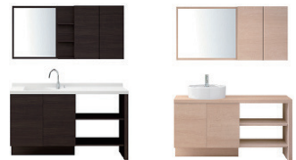
●ポウルー体タイプ ●ベッセルタイプ

シンプルで使いやすい「ポウルー体タイプ」に加え、木製カウンターに陶器製洗面器をセットした「ベッセルタイプ」もご用意。