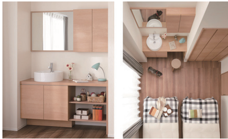
●コンパクト・ドレッサー「エスタ」ベッセルタイプ施工例

「エスタ」は、住まいの「セカンド洗面(2台目の洗面化粧台)」として最適なコンパクト・ドレッサーです。実際にセカンド洗面を設置されている方の満足度は非常に高い傾向にあり、そこで今回「狭い場所にも設置しやすい