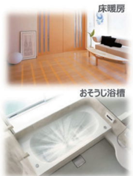
※おそうじ浴槽はGoogleアシスタントのみ対応