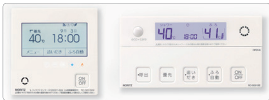
無線LAN対応給湯器リモコン「RC-G001EWシリーズ」、「RC-G057PEW」

ノーリツは2019年8月2日よりGoogleが提供しているスマートスピーカー「Google Home」などGoogleアシスタント搭載のデバイスおよび、LINEが提供しているスマートスピーカー「Clova Desk」や「Clova Friends」などAIアシスタントClova搭載のデバイスに対応。無線LAN対応給湯器リモコンとスマートスピーカー、スマートフォン等が無線LANを介して通信することで、音声による浴槽へのお湯はりや床暖房のON・OFFなどの操作が可能です。