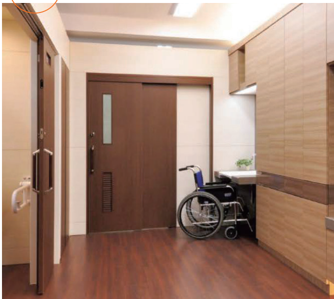
気くばりUDドア ウイルテクトタイプイメージ