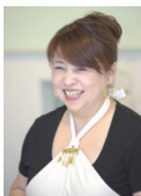
Makoの 今月のごちそうさま レシピ 第170回