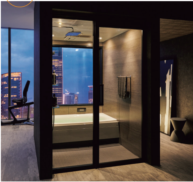
〈ホームジムスペースの中心にバスルームを配したプラン〉 トレーニングメニューの間のリフレッシュや、ワークアウト後のリラックスなど、自分らしい、私だけの、魅力的なバスルームをカタチに。 バスルーム：BLM1311