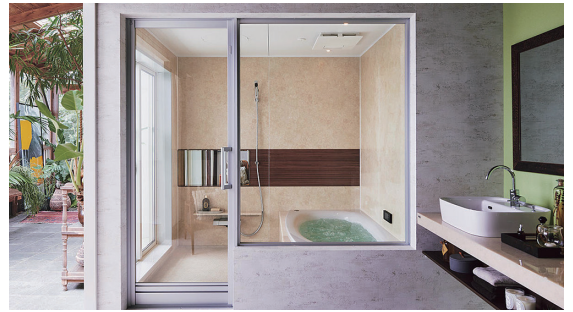
〈リゾート感あふれるスパをイメージしたプラン〉