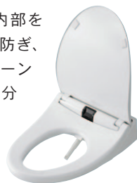
ウォシュレット アプリコット

除菌水が自動的に内部を洗浄。汚れの発生を防ぎ、使用前の状態をクリーンに保ちます。また、自分の好きなタイミングで電解除菌水ノズル洗浄ができる「ノズルきれい」ボタンを新設しました。