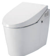
ネオレスト ハイブリッドシリーズ AH

女性にとっての心地よさを見つめ「ワイドビデ洗浄」を新しく搭載しました。広い範囲をやさしくサッと洗える「ワイドビデ洗浄」と、スポットでやさしくしっかり洗える「ワンダーウェーブビデ洗浄」の使い分けにより、清潔さを保ち、不快さを軽減します。「ビデ洗浄」と「ワイドビデ洗浄」を使い分けて快適さと便利さを実感してください。