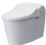
ネオレスト ハイブリッドシリーズ RH