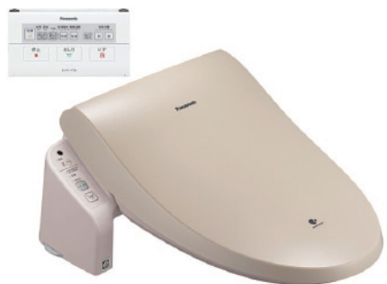
※DL-WEN60-CP(パールアイボリー)

パナソニックは、便座とシャワーを使うとき瞬時に温める(室温が15度以下の場合、約15度で便座を保温)「W瞬間方式」において、便座温度の検知精度を向上することにより、業界No.1*の省エ