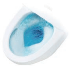
プラズマクラスター

サティスGタイプ・Sタイプ共通の機能としては、シャープ社のプラズマクラスター技術で便器の鉢内の除菌をする「鉢内除菌」を搭載します。便フタを閉じた状態で便器鉢にプラズマクラスターイオンを放出。便器鉢はもちろん、便座裏の付着菌や浮遊カビ菌をしっかり除菌。さらに染み付いたにおいで、しっかり脱臭します。