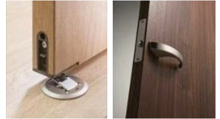
内蔵ドアストッパー

昨今のインテリアトレンドに対応するため、銘木ウッド調では、材の濃淡や節など自然味あふれる木の素材感を、最新の印刷技法を用い表現しています。柄だけでなく手触りにもこだわることで、今までにないリアルな木の素材感を表現しています。